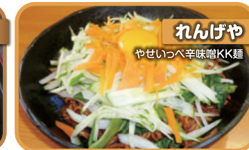
れんげや やせいっぺ辛味噌KK麵