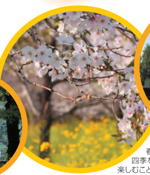
春には公園内に桜や菜の花が咲き、四季を通してのレジャースポットとして、楽しむことができます。