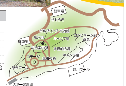
KIJO SIGHTSEEING GUIDE

※町外の方は別途衛生管理費(100円)をいただきます。 お問い合わせ先/川原自然公園総合案内所 TEL.0983-32-4122(FAX兼用)