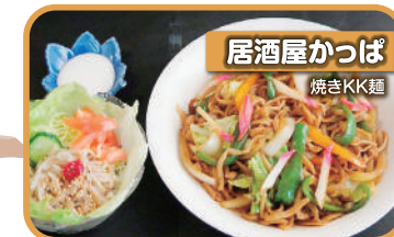
居酒屋 かつば 焼きKK麵