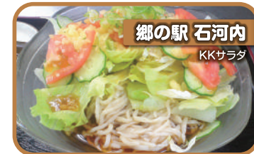
郷の駅 石河内 KKサラダ