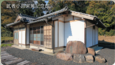
武者小路実篤記念館

実篤と十次、二人の偉人は木城町に、豊かな自然と同じくらい大切なものを残してくれました。それは人間としての愛、ヒューマンイズムです。