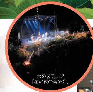
水のステージ 「星の夜の音楽会」

この郷は周囲を山々に囲まれ、 ゆったりと静かな時ながれる 自然の宝庫。感性を育む自然のゆりかごです。絵本を中心に 演劇や音楽を楽しむファンタジーゾーンです。ここで子どもに 戻ってみませんか。そして子どもたちと同じ目線でゆっくり話し 合ってみませんか。