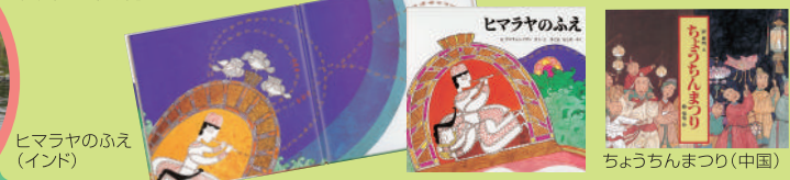
ヒマラヤのふえ (インド)

木城えほんの郷では、良質の絵本原画の収集を進めてきました。そのコレクションのなかから、アジアの土の香りのする作家の作品に注目し、4冊の絵本を復刊しました。