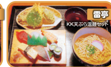
雷亭 KK天ぷら温麺セット