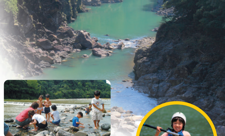
夏には、流れのゆるやかな小丸川は河川プールになり、多くの子供達でにぎわいます。