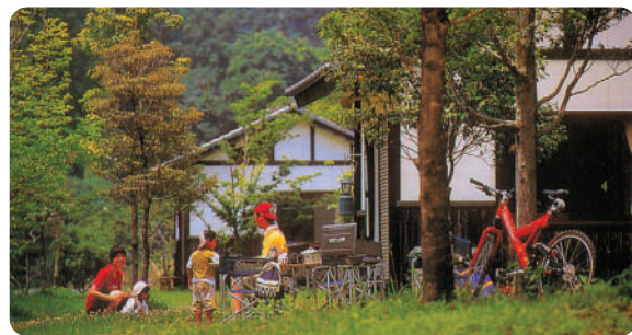
KIJO SIGHTSEEING GUIDE

家族や団体でのキャンプなら川原自然公園のキャンプ場がおすすめ。清流・小丸川に沿って自然の景観をまるごと活かした公園には、快適なキャンプが楽しめるよう、コテージ、炊飯棟、温水シャワー、バーベキュー棟などの施設が充実しています。川遊び、カヌー遊びなどでたっぷり遊んだ一日のフィナーレは、輝く星空の下でのキャンプファイアが魅力です。