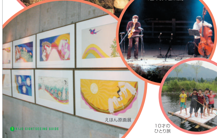
水のステージ 「星の夜の音楽会」

平成6年に開催された、絵本原画の世界的なコレクションである「ブラティスラバ世界絵本原画展」をはじめ、アメリカ黄金期の代表的な絵本作家マーシャ・ブラウン、マリー・ホール・エッツなど、国際的な原画展が次々と開催されてきました。その他にも、山下洋輔、小曾根真、平野公崇などを招いてのコンサートやお花見狂言会などの催し、「里山探検隊」「木の実草の実遊び」「むしむし合宿」「お米づくり」などの自然との関わりを大切にしたい体験活動など、えほんの郷ならではの活動がおこなわれています。