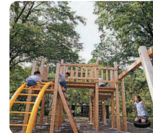
幼児や小学生が楽しく遊べるアスレチックや遊具等も設置されています。