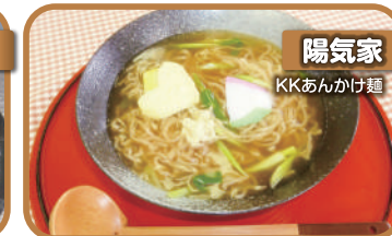
陽気家 KKあんかけ麵