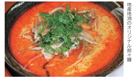
地産地消のオリジナル担々麺

創業以来人気の担々麺は、香り高い胡麻ペーストが旨味を引き立たせる逸品。辛さも2倍～8倍激辛と選べるので、お好みの辛さで味わうことができます。