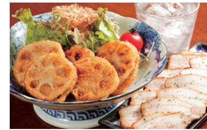
れんこんはさみ揚げる600円、焼豚600円

アットホームな空間の中、大阪で修行した経験をもとに海鮮お好み焼き(500円)、山芋ステーキ(600円)など30種類以上の居酒屋メニューを揃えている。毎月メニューの入れ替えを行って季節に合わせた品々が楽しめる。