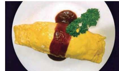
こだわりのソースのオムライス

1人1時間420円~、最新機種でライブの臨場感が楽しめます。本人映像も豊富。ソフトドリンク、酒類、おつまみ、食事までフードも充実しているため、長時間満喫するのにうってつけ。