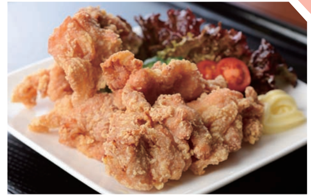
炭火焼ランチ850円はデザート&ドリンク付きでボリューム満点

みやざき かしわや tel.0985-75-6744 | ランチ 注文ダイヤル 0120-947-229 国富町大字竹田962-1 日曜・祝日(営業の場合あり) 圃10:00~18:30 有 圃14