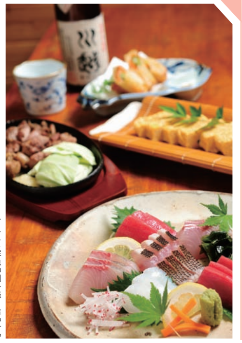
オススメ鮮魚の刺身盛り合わせや黒岩土鶏の卵で作った卵焼き