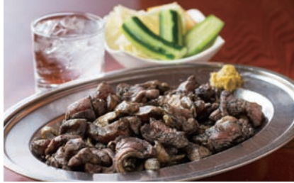
もも焼1100円。骨付きもも入りです

持ち帰りの定番メニューになっている鶏の炭火焼をはじめ、唐揚げや新鮮野菜サラダ、地鶏のタタキなども好評です。毎日仕入れる骨付きももは数に限りがあるため、早めの注文がベター。