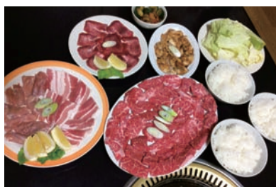
一番人気のニニコセット。

おすすめ あじ定食1,080円、焼おにぎり定食1,080円、チキン南蛮定食1,080円、コース料理2,160円より