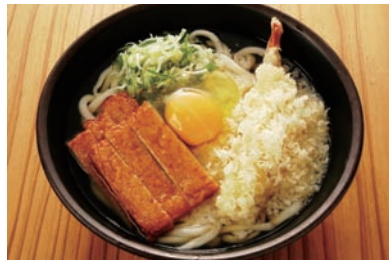
ネビに天ぷら、玉子も入った スペシャルうどん500円