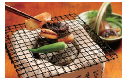
店は夫婦2人で切り盛り。カウンターで会話を楽しもう