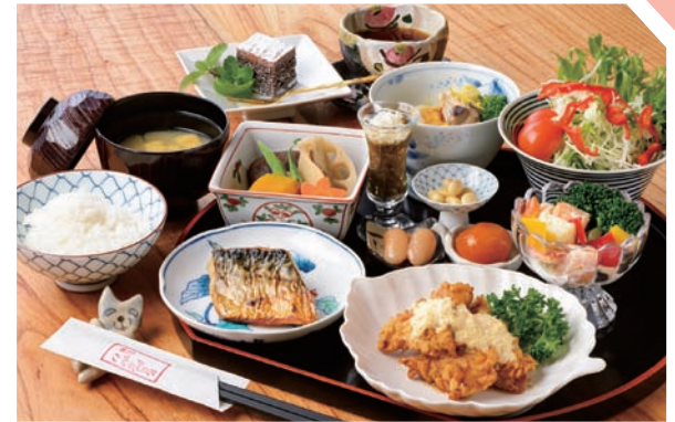
品数豊富で華やか! 週替りのおまかせランチ1,080円