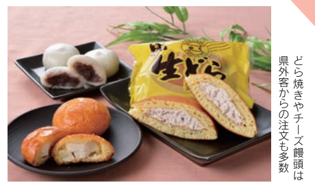
どら焼きやチーズ饅頭は県外客からの注文も多数