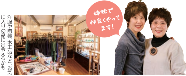
姉妹で仲良くやります!