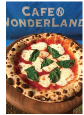
ナポリピッツアの定番マルゲリータ

懐かしくも新しいふるさとをテーマに、築70年の古民家をカフェに。こだわりのコーヒーや手作りの石窯で焼くピッツア、手打ちうどんの Pasta など、オリジナルの料理も充実。心地の良い時間が過ごせます。