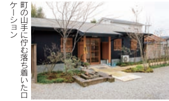
町の山に佇む落ち着いた口ケイション

国富町大字八代北俣279-1 休月・火曜日 10:00~16:00(ランチ11:00~14:00) 有 園15