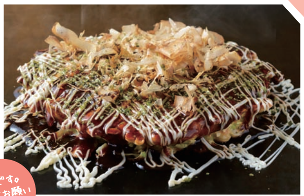
豚玉500円。お好み焼きは自分で焼いてもOK

てっばんやき たまや tel.0985-75-1455 | 座敷 国富町大字本庄4515 日曜日 圏17:00～22:00 P有 圏20