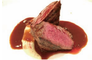
ディナーでは本格的なフレンチのコースが堪能できます

見晴らしの良い高台にあるフレンチレストラン。オーナーシェフはフランス、東京で修行を積み、優れた食材を求めて国富町に店を構えたそう。ランチのほか、コース料理、子ども向けメニューも充実しています。