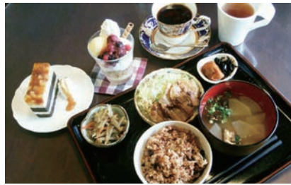
長岡式酵素玄米定食

おすすめ おすすめランチ1,650円 ディナー パリコース (ドライエイジングビーフ) 5,800円