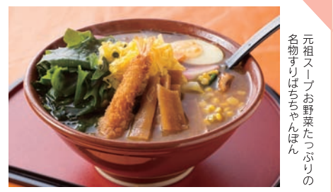
元祖スー!お野菜たっぷりの名物すりばちちゃんぽん