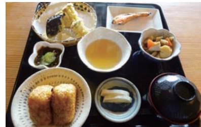
子どもも大好きな焼おにぎりの定食があります

自宅を開放して営まれている和食店。チキン南蛮やエビフライといった定番から、呉汁や焼おにぎりといった家庭的なものまで、さまざまな定食が楽しめます。自家製野菜も栽培中。手作りデザートも人気です。